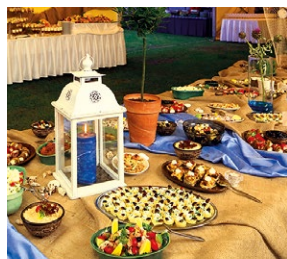
speciality balkánské kuchyně