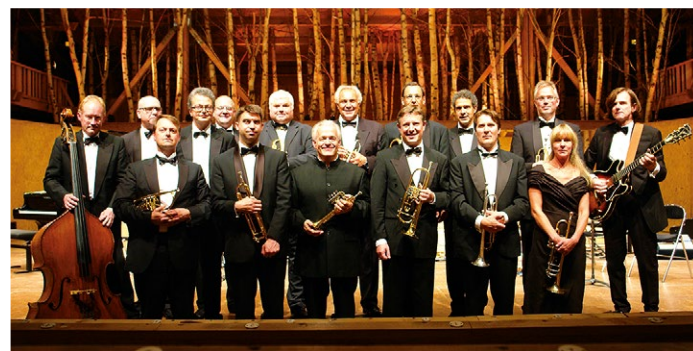
Ten of the Best &amp; Friends

Prodlouženým víkendem ve dnech od 9. do 11. srpna se MHF ČK 2012 překlápí do své druhé poloviny. Co pro vás během nich nabízí? Čtvrtek i pátek jsou ve znamení ostře sledovaných komorních koncertů v Maškarním sále. Nejprve