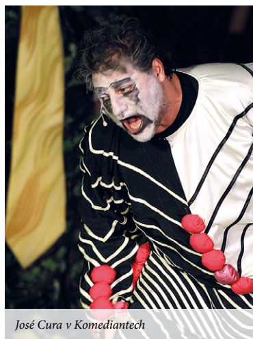
José Cura v Komediantech