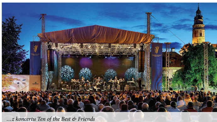
...z koncertu Ten of the Best & Friends