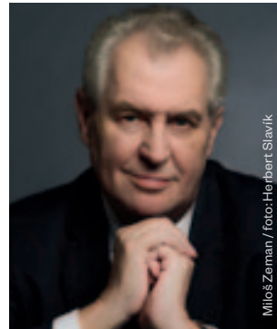
Miloš Zeman