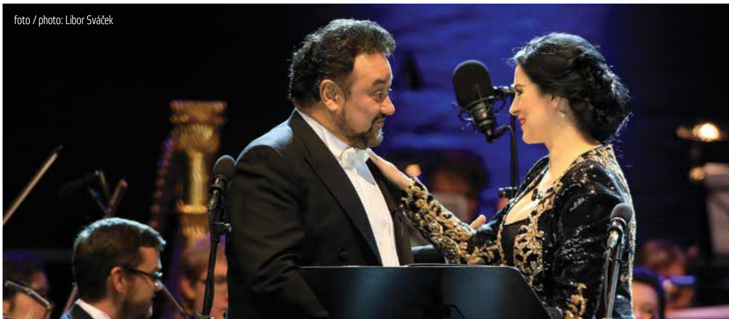
Zahajovací galakonzert Angely Gheorghiu a Ramóna Vargase / Opening gala concert of Angela Gheorghiu and Ramón Vargas