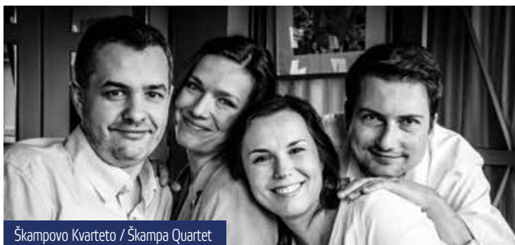
Škampovo Kvarteto / Škampa Quartet

V druhém týdnu nabídne MHF Český Krumlov pět koncertů. V úterý 18. července vystoupí v Maškarním sále českokrumlovského zámku Škampovo kvarteto , v jehož podání zazní díla klasiků. Jeden z Haydnových nejnámějších kvartetů – Smyčcový kvartet D dur „Skřivánci“, Mozartův Smyčcový kvartet C dur „Dissonantní“ a v druhé půli večera Beethovenův Smyčcový kvartet op. 59 č. 3 „Razumovský“.