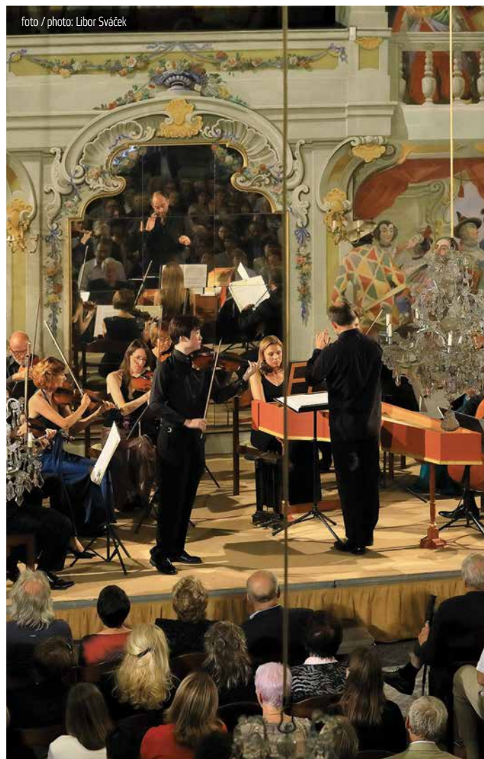
FESTIVAL SE KONÁ ZA LASKAVÉ PODPORY | THE FESTIVAL IS HELD WITH THE KIND SUPPORT OF