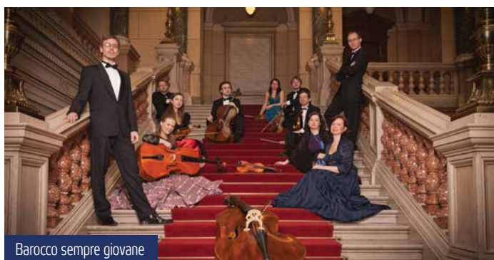
Barocco sempre giovane