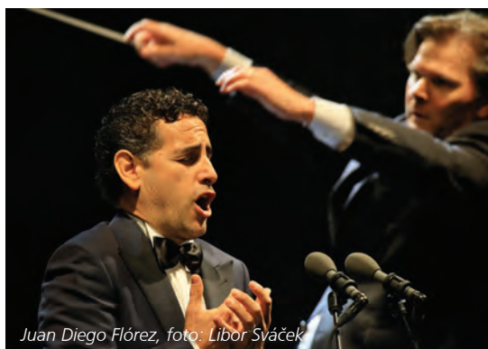
Juan Diego Flórez

Mezinárodní hudební festival Český Krumlov 2016 začal v pátek 15. července festivalovým prologem Vivat festival!, hudebně-obrazovou fantazií k 25. jubileu MHF, která se odehrála na jižních zámeckých terasách. Obyvatelé i návštěvníci Českého Krumlova dostali tuto poctu městu i festivalu jako dárek, vstup byl zdarma. Početné publikum na protějším břehu i na mostech zhlédlo barokní ohňostroj a reálné i fantaskní obrazy promítané na zdi zámku či do