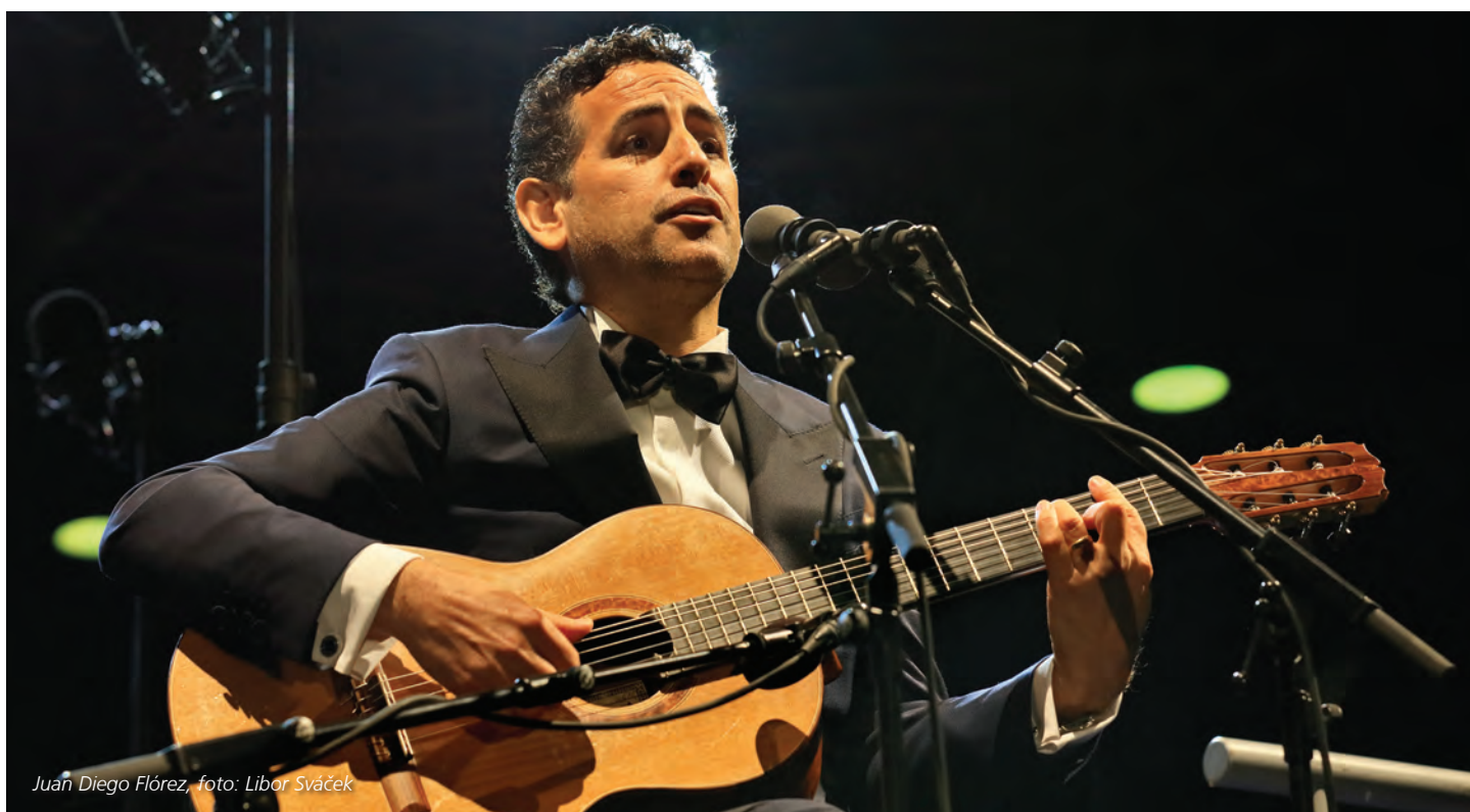
Juan Diego Flórez