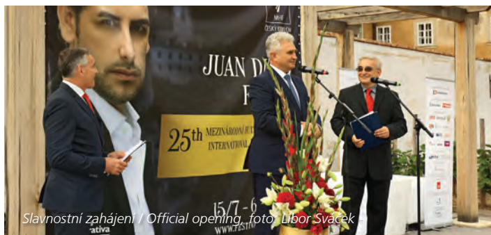
Slavnostní zahájení / Official opening