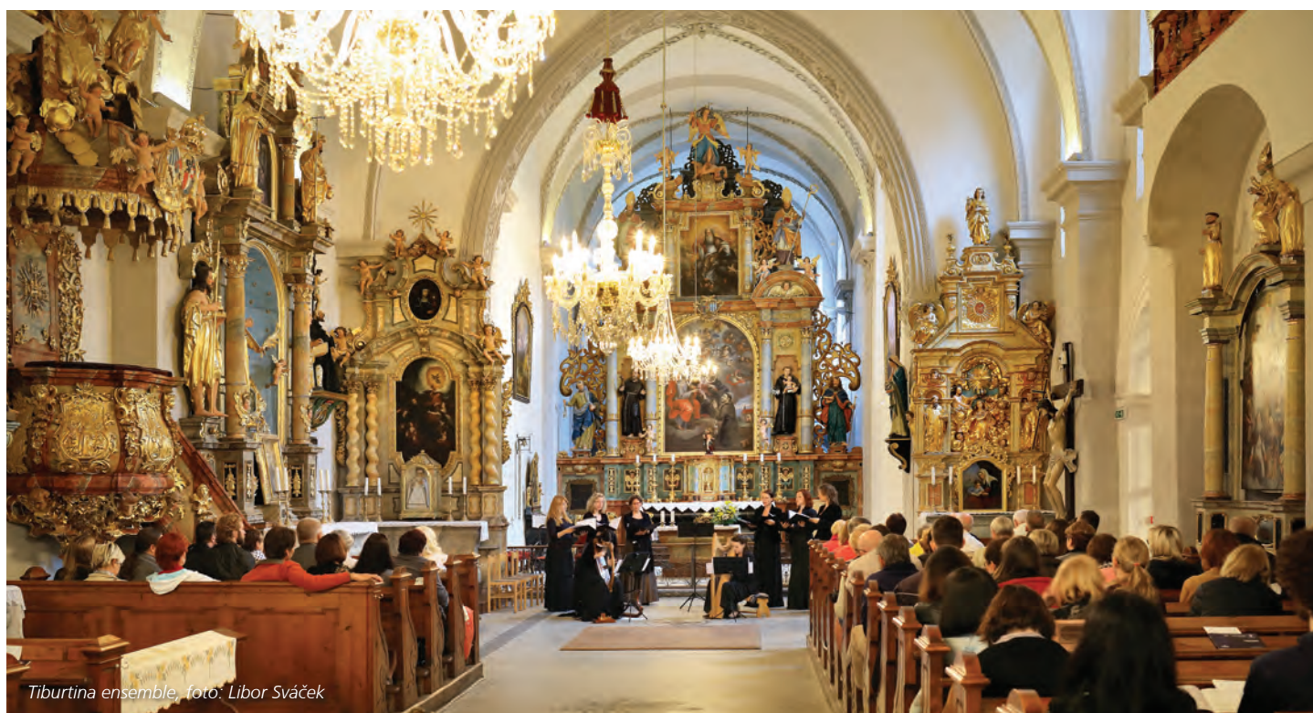
Tiburtina ensemble